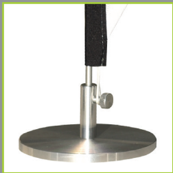
Stabilité garantie grâce à son embase