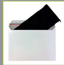
Format mini pour le transporter facilement partout