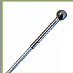
Sommet renforcé pour protéger et enfiler la voile facilement