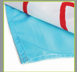
Polyester maille bloquée 115 g/m 2 avec impression par sublimation