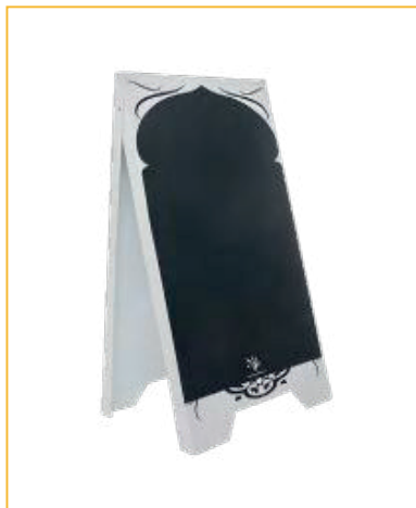
RÉF. PFN36-02 MODÈLE ORIENT