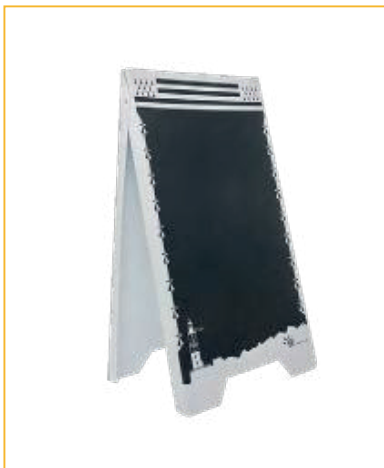
RÉF. PFN36-01 MODÈLE BRETAGNE