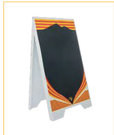
RÉF. PFN36-03 MODÈLE CATALAN